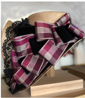
Chapeau de Salers