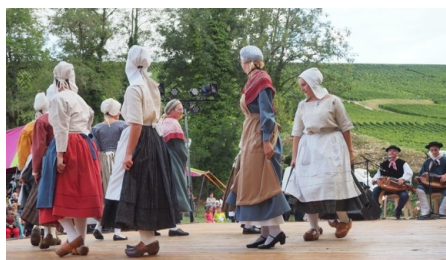
La Sabotée Sancerroise

Les membres des Tréteaux s'emploient activement à l'organisation de ces 2 jours : hébergements, repas, mise en place de publicité plusieurs semaines à l'avance sur les marchés hebdomadaires, jeux et moments de détente, tombola, recherche de partenaires publicitaires.