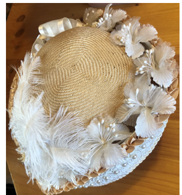
Chapeau de mariée en cours de fabrication

J'utilise par exemple de la dentelle de laine, qui se tient mieux (jusqu'à 9m par chapeau), ensuite, je fais des recherches personnelles sur les méthodes de montage."