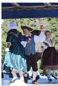
Empi et Riaume