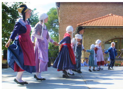
Vichy et ses Sources